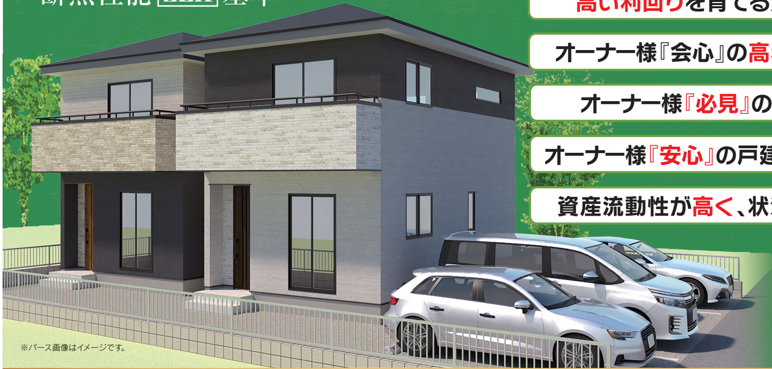
※パース画像はイメージです。