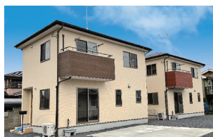
大田原市美原2丁目/2棟 令和4年9月完成(満室)