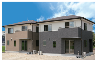
大田原市加治屋/2棟 平成28年7月完成(満室)