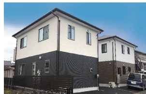
小山市城東/2棟 令和2年完成(満室)