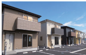
小山市喜沢/6棟 平成31年完成(満室)