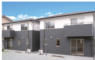
宇都宮市石井町/4棟 平成28年完成(満室)