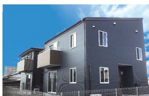
大田原市中田原/2棟 令和2年1月末完成(満室)