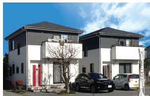
鹿沼市貝島町/2棟 平成25年完成(満室)