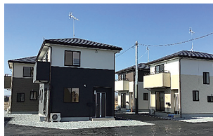
大田原市加治屋/4棟 平成31年3月完成(満室)