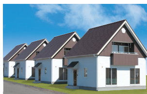
鹿沼市栄町/2/4棟 平成23年完成(満室)