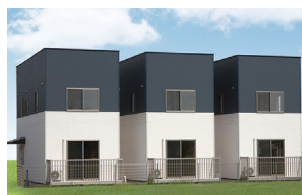
栃木市西方町金崎/3棟 平成24年完成(満室)