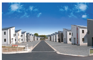
鹿沼市千渡/22棟 平成27年完成(満室)