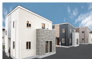
小山市横倉/3棟 令和4年完成(満室)