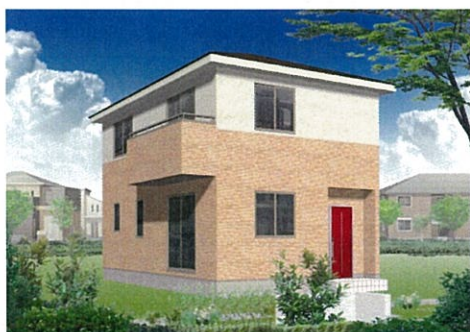
◎アーバンキュービックI3L-II 東玄関タイプ