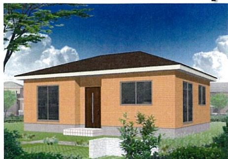
◎貸家の定番！なごみ2LDK南玄関タイプ